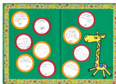
寄贈先の学童保育施設からお礼のメッセージをいただきました(一例)