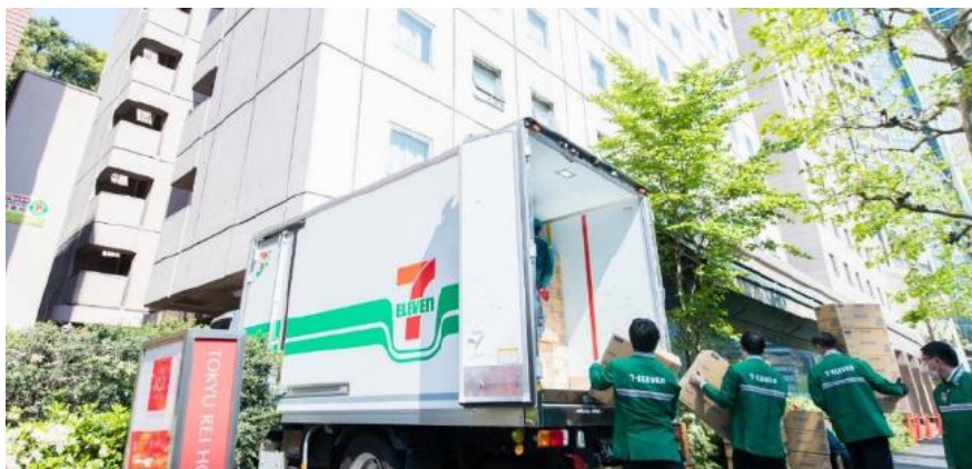
宿泊施設への食料運搬の様子